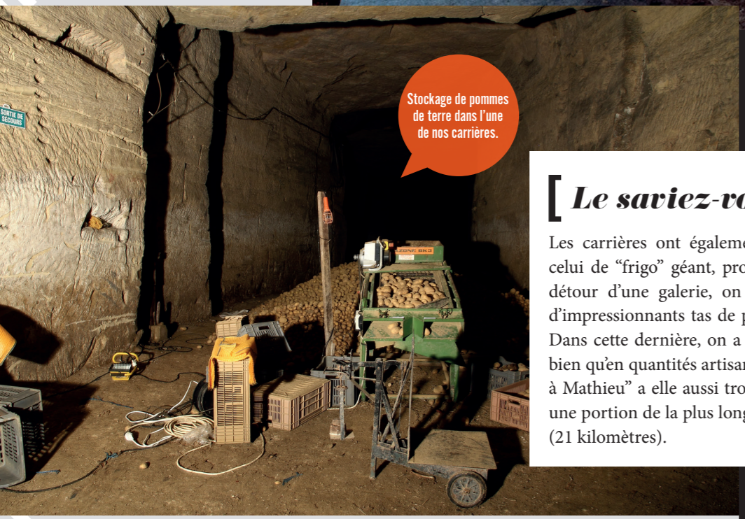
Stockage de pommes de terre dans l'une de nos carrières.