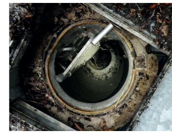
UN PUIT D'ACCÈS DESTINÉ À FACILITER LA SURVEILLANCE DES RÉSEAUX DE GALERIES.

Ces carrières, déjà dangereuses lorsqu'elles étaient encore en activité - le registre de la paroisse enregistre par exemple, le 11 avril 1643, la sépulture "d'un ouvrier tué à une carrière de Carrières" -, constituent toujours une menace invisible, dont tient compte le plan d'urbanisme de la commune.