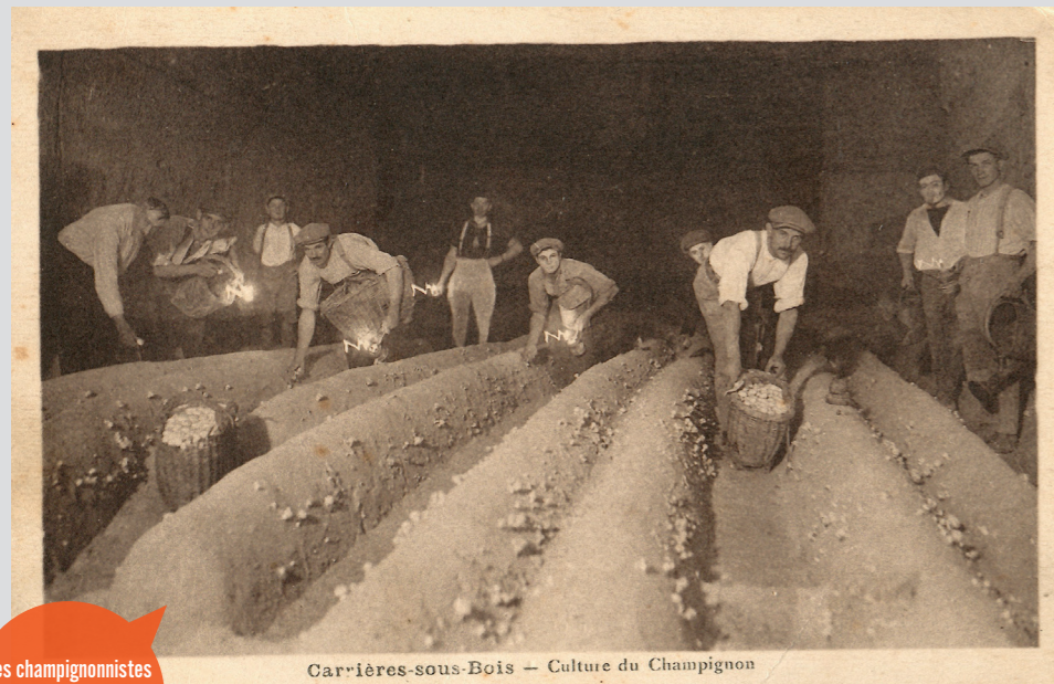
Les champignonnistes au travail. Début du XX ème siècle.