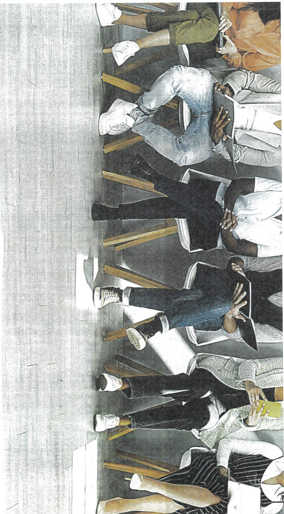
Bien que les frontières entre les deux industries tendent à s'estomper, la culture d'entreprise reste un facteur déterminant pour les candidats.

D'autres entreprises sont allées encore plus loin en adoptant des politiques de « workaway », qui permettent à leurs collaborateurs de